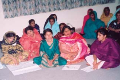
ٽيچرس هوم اسڪول جي تربيت دوران گروپ ورڪ ۾ مصروف آهن