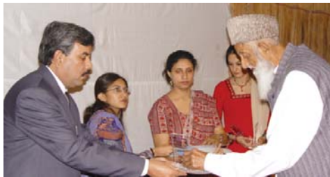
ايم او يو تقريبن ۾ اسڪول جا سنڀاليندڙ صحي ڪندي

گذريل ٽن مهينن ۾ 300 اسڪولن مان 133 وڌيڪ خانگي اسڪول اسپيپ جا پائيواري بڻيا. انهن نون اسڪولن ۾ حيدرآباد مان 68 اسڪول، نٿي، دادو ۽ بدين مان 13 اسڪول ۽ 26 اسڪول خيرپور مان شامل آهن. نون اسڪولن جي شامل ٿيڻ لاءِ ياداشتنامي تي صحي جي تقريبن 7 اپريل 2005ع تي حيدرآباد ۽ 9 اپريل 2005ع خيرپور، بدين ۽ نٿي ۾ ٿي گذري.