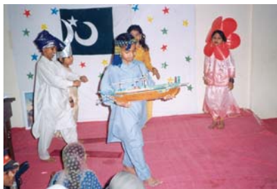
سي ڊي سي ۾ ٻار پاڪستان جو ڏيهائڙو ملهائي رهيا آهن

ڄاڻايل ليبر ايجوڪيشن پروگرام (ڪليپ) جي ڄاڻايل ڊيولپمينٽ سينٽر ۾ 23 مارچ 2005ع تي يوم پاڪستان ملهائڻ جي حوالي سان پروگرام ٿي گذريو. جنهن ۾ سي ڊي سي جي ٻارن ڏاڍي جوش خروش سان مختلف سرگرمين ۾ حصو ورتو جن ۾ تقريرون، قومي گيتن جا مقابلا ۽ پورهيت ٻارن جي مسئلن تي خاڪا شامل هئا. ان سان گڏوگڏ يوم پاڪستان جي حوالي سان ٻارن لاءِ ڪوئڙي پروگرام پڻ ترتيب ڏنو ويو. هي تقريب تقريباً 3 ڪلاڪ جاري رهي، جنهن ۾ ٻارن جي