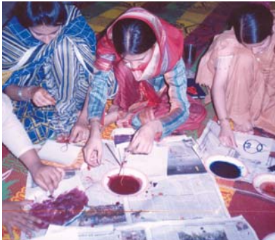
هٿ جي هنر ۽ دستڪاري جي تربيت دوران حصو وٺندڙ

گذريل ٽن ماهي دوران سنڌ ايڇوڪيشن فائونڊيشن (ايس اي ايف) جو ڪميونٽي بنياد تي ماڊل فيلو شپ اسڪول پروگرام 92 ٽيچرز لاءِ ريفريشر ڪورس شروع ڪرائڻ جو بندوبست ڪيو. هي تربيت هالا ۽ خيرپور ۾ ڪلسٽر ليول تي اپريل 2005ع جي پهرين هفتي ۾ ٿي. هن تربيت جو مقصد فيلو شپ اسڪولن جي ٽيچرز جي تعليمي معيار کي وڌائڻ ان سان گڏوگڏ ڪلاس روم ملٽي گريڊ ٽيچنگ، هٿ جو هنر، ڊرائنگ، فنڪشنز جو بندوبست ڪرڻ ۽ ايسمبلي ڪرڻ پڻ شامل هئا.