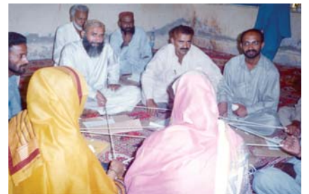
استاد "رابط ڪاري" جي تربيت حاصل ڪندي

فيلو شپ اسڪول پروگرام ڪميونٽي جي بنياد تي ماڊل اسڪول آهي، جنهن جو مقصد سنڌ جي 5 ضلعن ۾ معياري تعليم مهيا ڪرڻ آهي. انهيءَ سلسلي ۾ والدين تعليمي ڪاميٽي (پي اي سي) ٺاهي وئي ته جيئن اهي اسڪولن جي سارنڀال لهن. اها ڪاميٽي والدين ۽ ڪميونٽي جي نمائندگي ڪري ٿي. سنڌ ايڇوڪيشن فائونڊيشن پي اي سي جي وڌندڙ ذميوارين کي محسوس ڪندي انهن جي مهارتن کي اجا به وڌيڪ وڌائڻ ضروري سمجهو، ته جيئن اهي والدين تعليمي ڪاميٽيون فيلو شپ اسڪول جو انتظام بهتر طريقي سان هلائي سگهن. تنهنڪري ڪلسٽر جي بنياد تي تربيت ڏيڻ جو سلسلو شروع ڪيو ويو. جيڪا 2 مئي کان 25 مئي 2005ع تائين جاري رهي. هن تربيت جو مقصد هو ته پي اي سي جو اداري طور انتظام، بنيادي ريكارڊ رکڻ، اڳواڻي جون صلاحيتون، ڪميونٽي ۾ حرڪت آڻڻ، اسڪولن جي جانچ پڙتال، هڪ ٻئي سان گڏيلپو (Networking) ۽ رابطو وڌائڻ (Developing linkages) ۽ نون وسيلن جي ڳولها کي وڌائڻ. ايس اي ايف کي اميد آهي ته هن تربيت کانپوءِ ڪميونٽي انهن اسڪولن کي چڱيءَ طرح سان هلائي سگهندي.