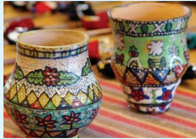
فن پارا پروجيڪٽ دوران پاران تخليق ڪيل فن پارا

هيومن رائٽيس ايجوڪيشن پروگرام (ايڇ آر اي پي) پاران، سنڌ ايجوڪيشن فائونڊيشن جي تعاون سان 17 مارچ 2005ع تي هڪ تربيت منعقد ڪرائي، جنهن جو مقصد ڪلاس روم ۾ ايڇ آر اي پي جي نصاب کي متعارف ڪرائڻ هو. تربيت ۾ سڀ کان اهم ڳالهه استادن کي اهو سڃاڻڻ هو ته هو شاگردن کي ڪهڙي طريقي سان انساني حقن جي مختلف پهلوئن بابت تعليم ڏين، ته جيئن اهي شاگرد سماجي تبديلي ۾ اهم ڪردار ادا ڪري سگهن.