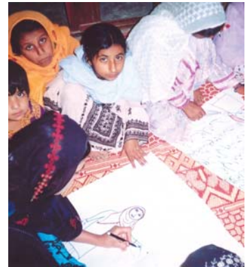
سکيا مرڪز ۾ سکندڙ گروپ ورڪ ۾ مصروف آهن

عورتن جي تعليم ۽ پاڻ پرائيپ واري پروگرام (ولپ) پاران صحت جي ڄاڻ بابت تربيتي ورڪشاپ ڪرايا ويا. هي تربيتي پروگرام 26 کان 29 مئي 2005ع تي ڪراچي ۽ 7 کان 10 مئي 2005ع تي سيوهڻ ۾ منعقد ڪيا ويا. جنهن ۾ ولپ پروگرام جي 26 سهولتڪارن ۽ ڳوٺ ناري سنگت جي عميدارن حصو ورتو. انهن تربيتن جو بنيادي مقصد تعليم ۾ صحت بابت ڄاڻ ۽ سرگرمين کي شامل ڪرڻ آهي، ڇاڪاڻ ته اهي ٻئي هڪٻئي لاءِ لازم آهن. عورتن جي تعليم ۽ پاڻ پرائيپ جو پروگرام (ولپ) 2001ع کان ملير ڪراچي ۽ سيوهڻ ۾ هلي رهيو آهي. ڪافي عرصي کان انهن سينٽرن ۾ داخلا ۽ حاضري جو تناسب گهٽجي رهيو هو، جنهن جو سبب گهڻي ڀاڱي غربت ۽ صحت جي خرابي معلوم ٿيو. ان مسئلي کي نظر ۾ رکندي ايس اي ايف پاران انهن سينٽرن جي عورتن کي صحت جي سنڀال بابت ڄاڻ ڏيڻ لاءِ اهڙا پروگرام ترتيب ڏنا ويا.